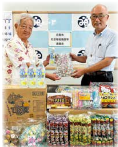
《こども食堂への寄付》