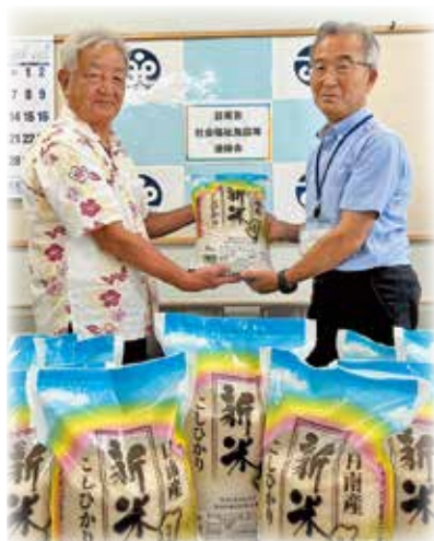
《こども宅食事業への寄付》

「貴重なものをたくさんいただきありがとうございます」「こどもたちにお菓子を渡すことを通して、たくさんの人が気にかけている、応援しているという想いを伝えたいです」という感謝の言葉がありました。