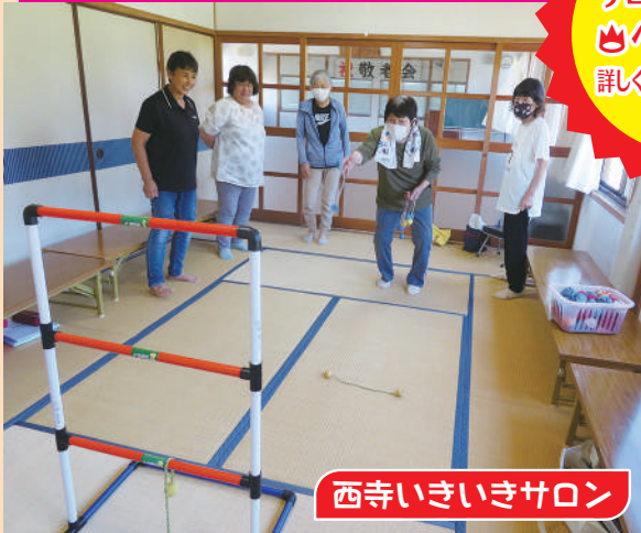
西寺いきいきサロン