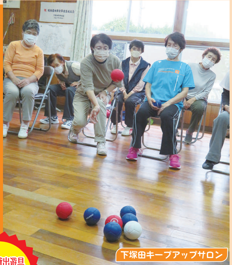
下塚田キープアップサロン