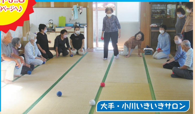
大手・小川いきいきサロン