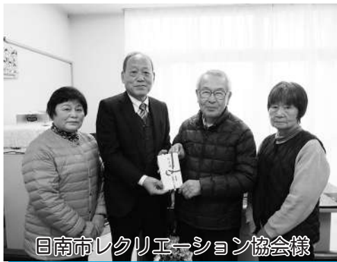
日南市レクリエーション協会様