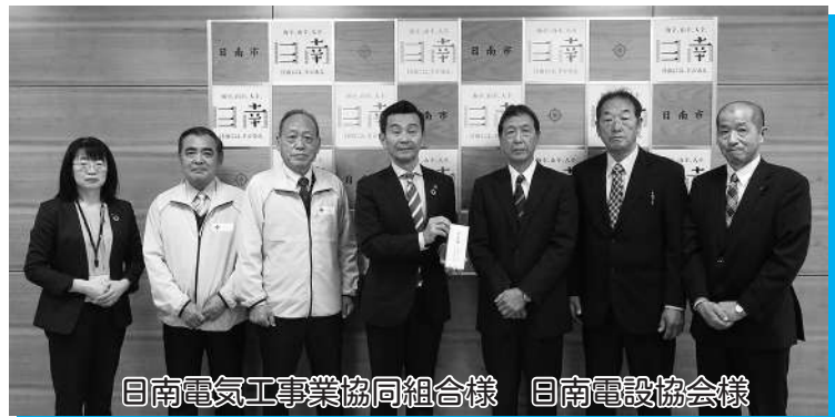
日南電気工事業協同組合様 日南電設協会様