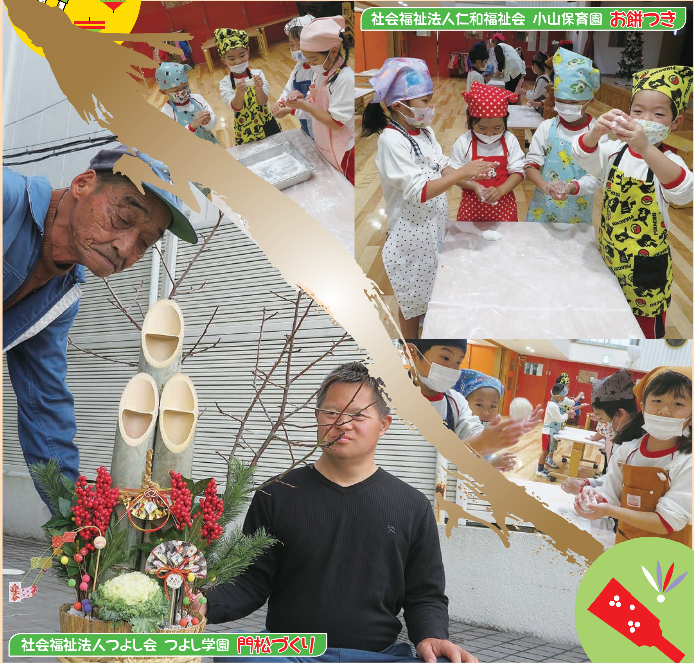
社会福祉法人仁和福祉会 小山保育園 お餅つき