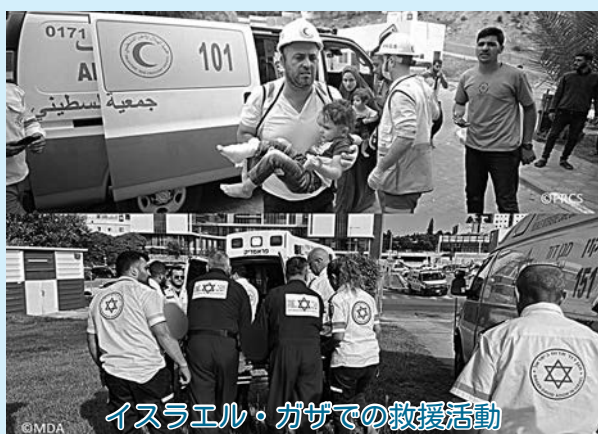
イスラエル・ガザでの救援活動

日赤では、世界中の災害や紛争、病気などに苦しむ人々を救うため、世界最大の赤十字のネットワークを活かして、緊急時の救援や復興支援、予防活動に取り組んでいます。