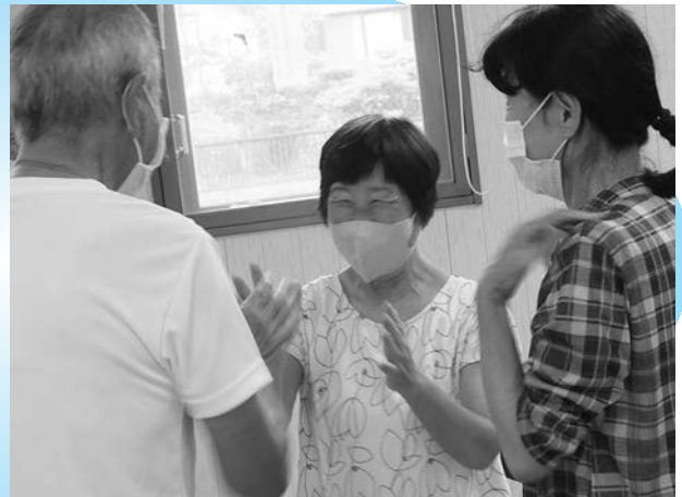
ふれあいいいきいきサロンの様子