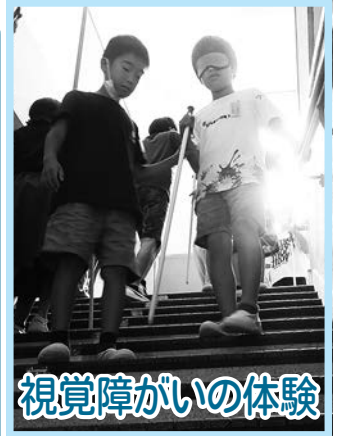
視覚障がいの体験

相手の気持ちを考えること、それに違いがあること、違ってもよいことを知った3年生が、「ふだんのくらしをしあわせにする」ために、どのように生かすのか楽しみです♪