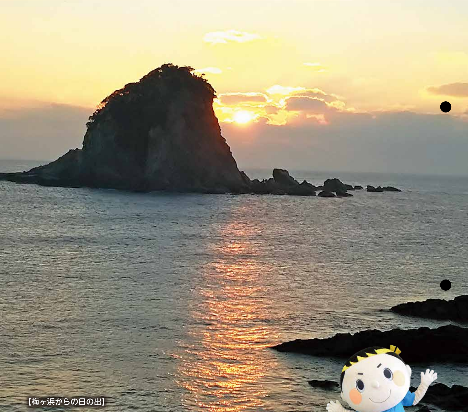
【梅ヶ浜からの日の出】