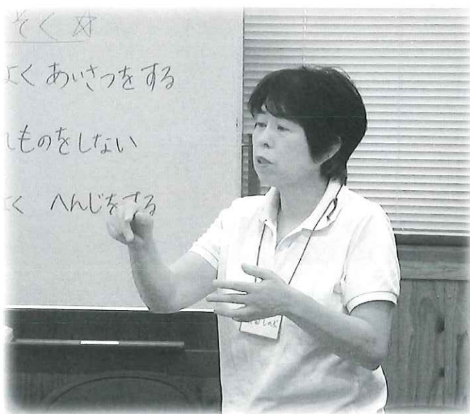
仲間と共に届ける『声』

この活動を長く続けてこられた理由は、まず好きな「声に出す」ことをして人様のお役にたてる喜び。そして仲間との交流、さらにもう一つ。この活動が自分の頭の体操にもなるということです。今後は若い方にもどんどん入って頂いて、新しい仲間とさらに楽しい活動にしたいと思っています。又、広報誌CD版のことをご存知ない目の不自由な方がお知り合いでいらっしゃいましたらお知らせ下さいませ。喜んでお届け致します。