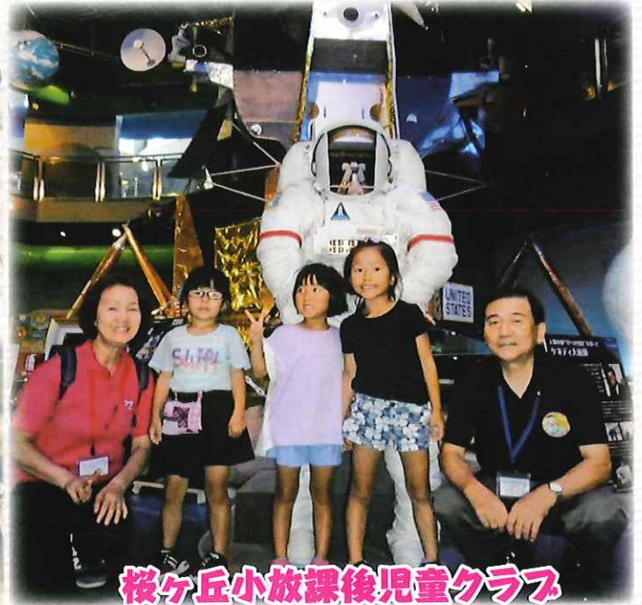
桜ヶ丘小放課後児童クラブ