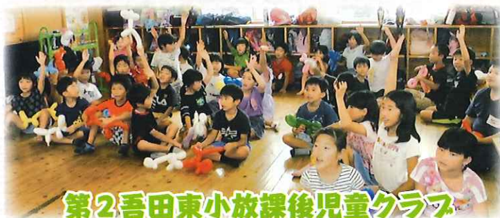
第2吾田東小放課後児童クラブ