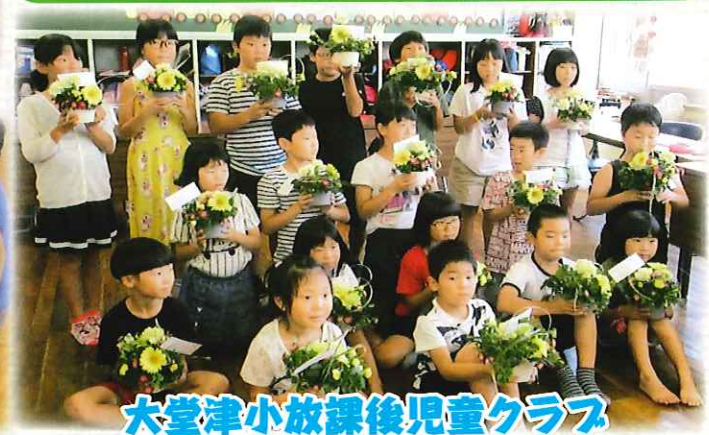
大堂津小放課後児童クラブ