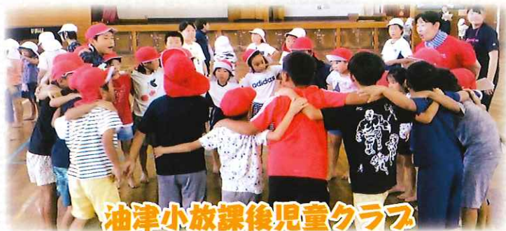
油津小放課後児童クラブ