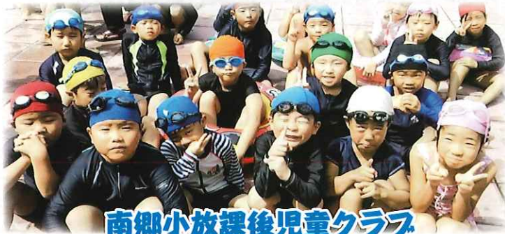
南郷小放課後児童クラブ