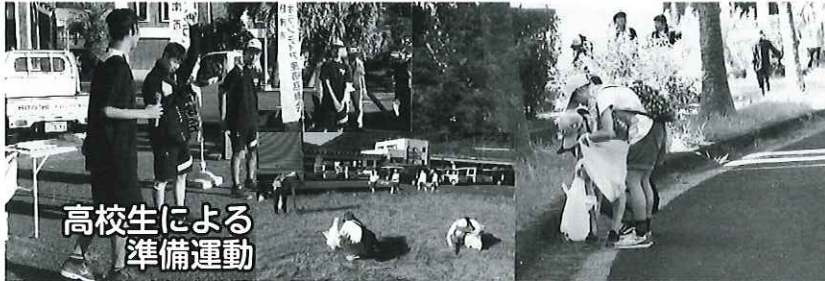
高校生による 準備運動

■県下一斉ボランティア推進事業 清掃活動「みんなでボランティア」に225名が参加しました。