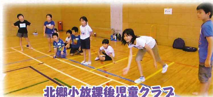
北郷小放課後児童クラブ