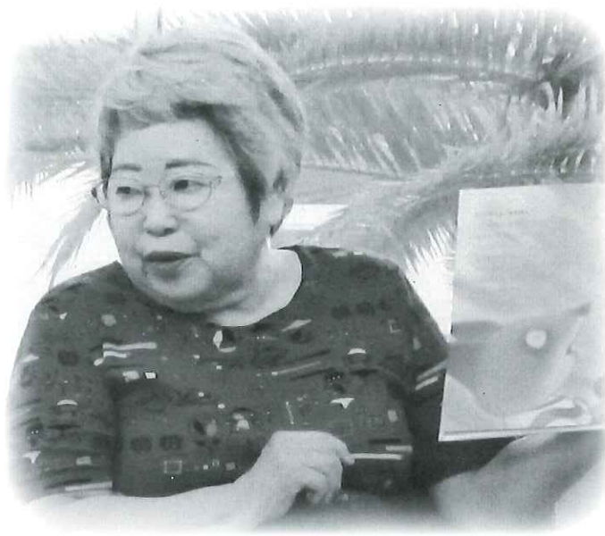
『声』で物語を聞く人に届けます