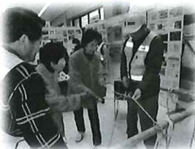
防災/ロープワーク