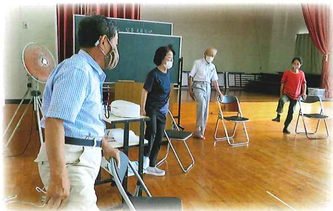
【写真】 下方ふれあいいきいきサロン

活動自粛で、しばらく外出活動も出来ずにいた地域の皆さんも、感染症予防に注意しながら、「ふれあいいきいきサロン」で元気に活動しています。