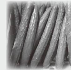
(有)中央ストアークろぎ様