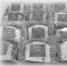
グローズ日南店様