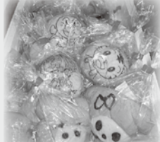
ゆめや・はくるま工房様