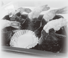
山野水産(有) ニコニコショップ様