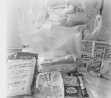
日南こども食堂様