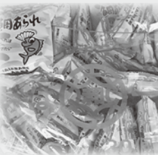
DYDOドリンク(株)山田本店様