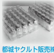
都城ヤクルト販売(株) 都城本社様