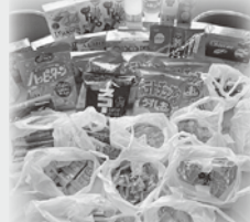
ダイナム宮崎日南店様