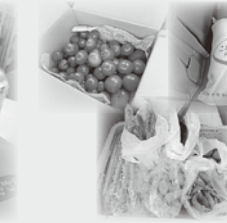
アグリショップあがた生活店様