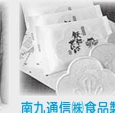
南九通信(株)食品製造部 飴肥せんべい様