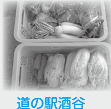
道の駅酒谷 納入生産者様