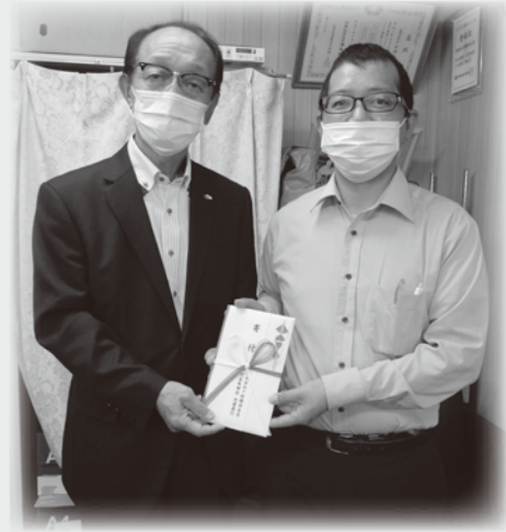
(株)戸村精肉本店様

この事業は事業所様からの善意で成り立っているもので、今後も事業所様の善意をお届けしてまいります。この事業にご賛同いただきありがとうございます。