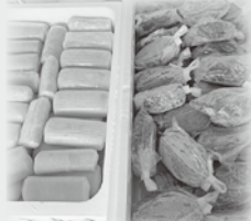
滝本かまぼこ店様